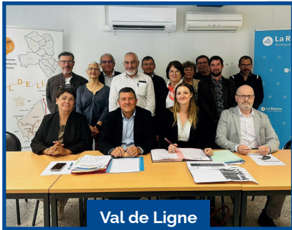
Val de Ligne

Merci aux élus, aux acteurs économiques et associatifs qui s'engagent au quotidien en faveur du développement durable de l'Ardèche Méridionale et de la Montagne Ardéchoise.