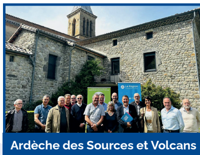
Ardèche des Sources et Volcans