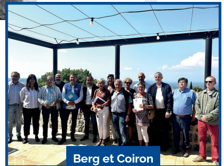
Berg et Coiron