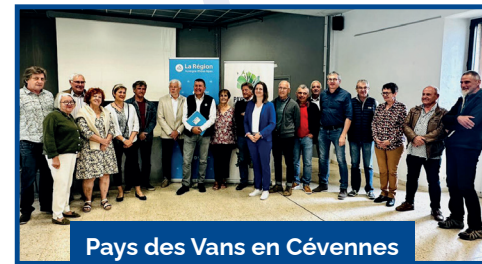
Pays des Vans en Cévennes