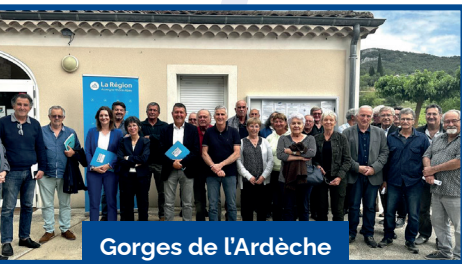
Gorges de l'Ardèche